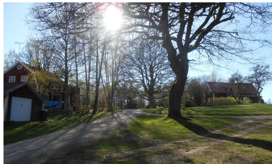
Håringe Dalhem och Ekhöjden.